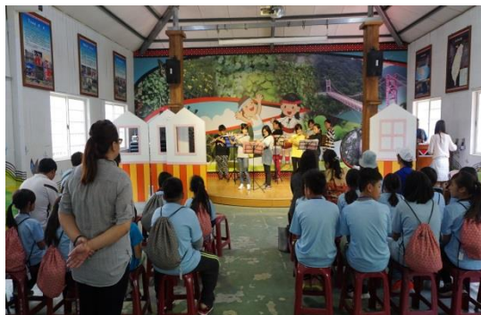
桃園霞雲國小的迎賓表演—長笛合奏