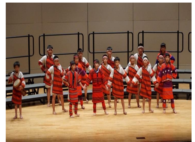
首次踏上南投縣演藝廳展現歌喉