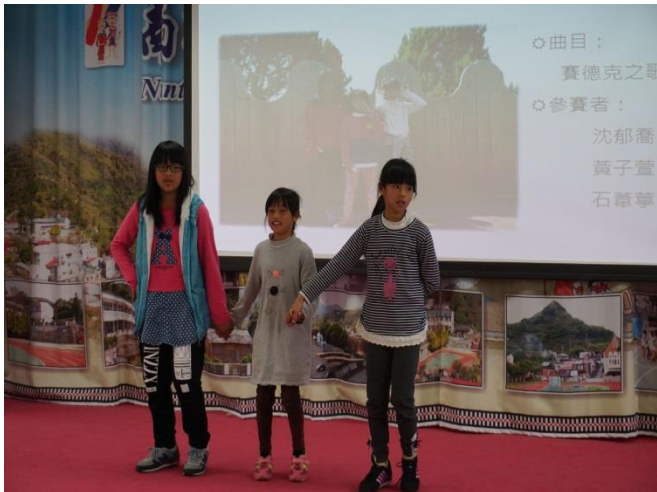
利用校內各班歌謠比賽為正式比賽暖身