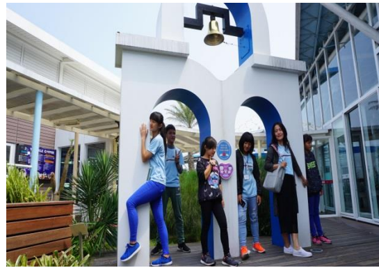
校長和畢業生留下美麗的情影