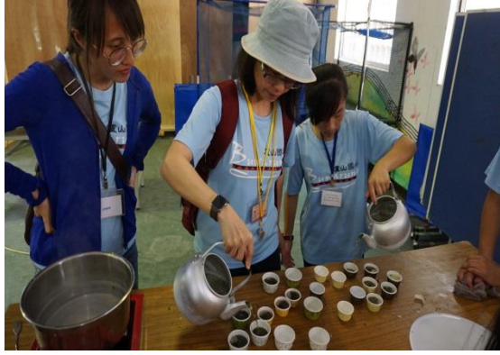
藥皂定型後等冷卻告成