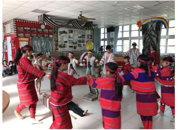
週三是我們練習歌舞劇的時間