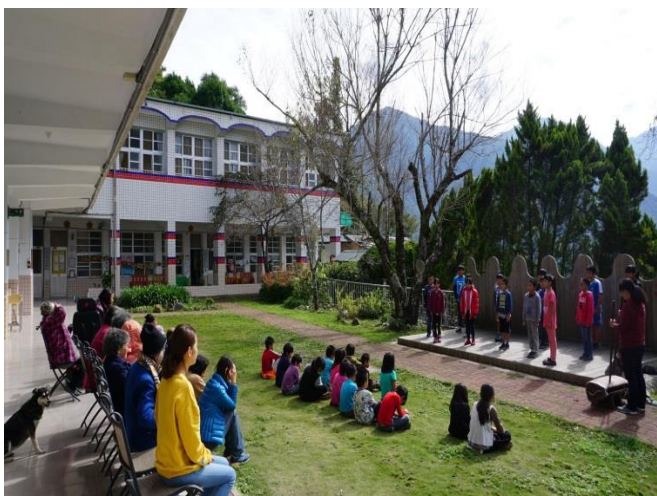
比賽前先請部落耆老到校聆聽驗收