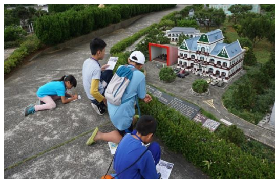
分工找答案—使命必達