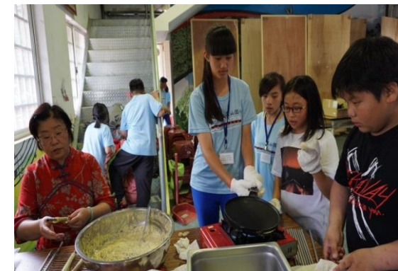
順便烤個藥草鬆餅吃吃