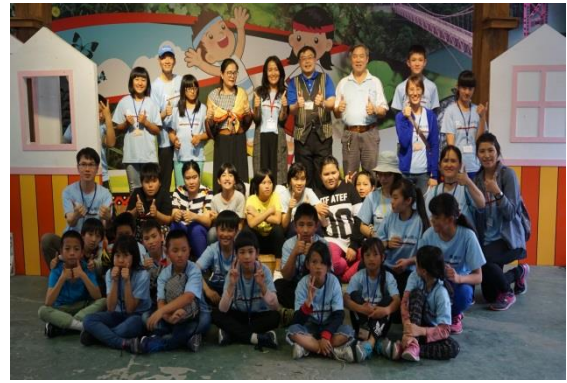
兩校師生合影留下美好回憶