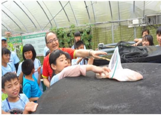
魚菜共生最大功臣—魚