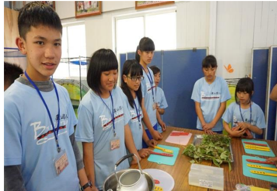
遊學課程—認識藥草