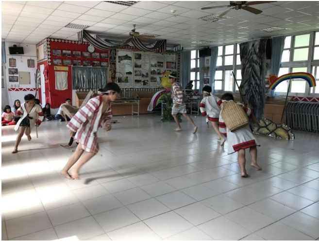
週三是我們練習歌舞劇的時間