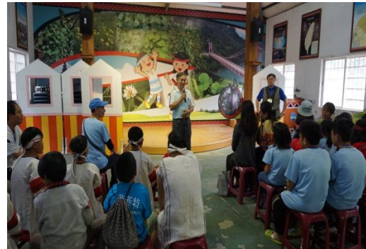
桃園市復興區駐區督學到場勉勵