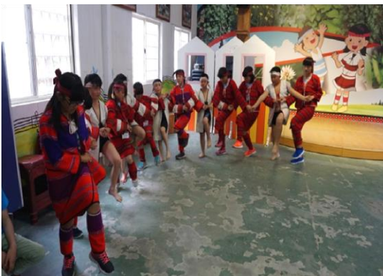
本校學生傳統賽德克歌舞表演