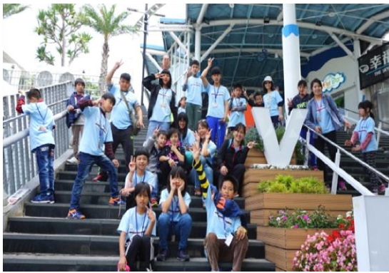
中途高速公路休息站好好玩