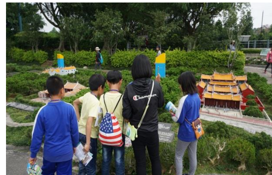
最後再檢查一下答案喔！