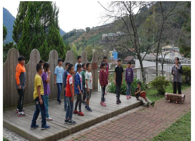
臨賽前的暖身需要實境模擬演出