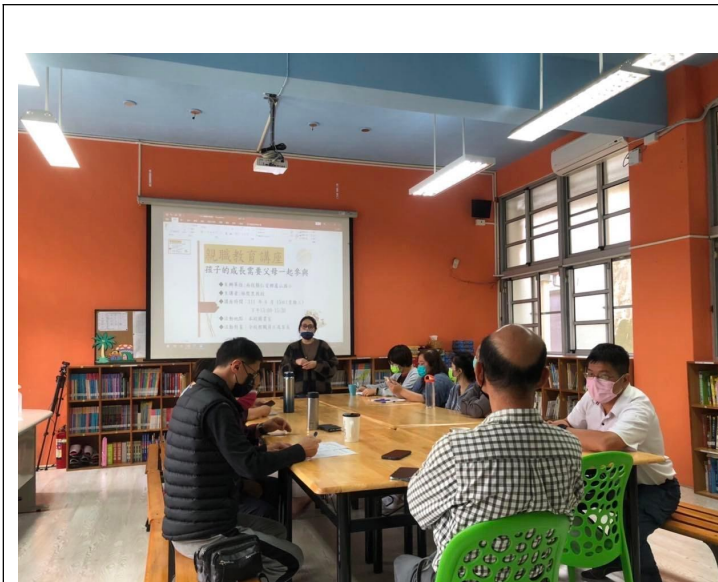
說明:親職教育分享