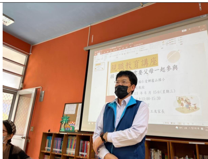
說明:校長說明家庭教育運作主軸