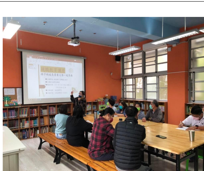
說明:親職教育分享