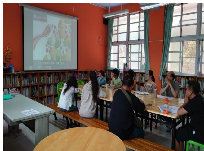
說明:親職教育線上宣講