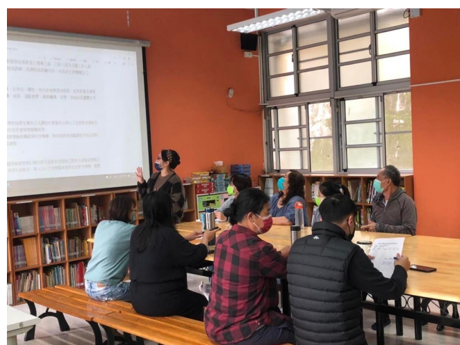
說明:玉雪老師家庭教育法規宣導