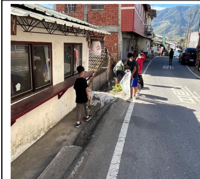
說明: 每個角落都要打掃乾淨