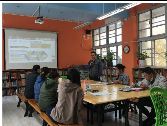
週三進修-閱讀評量素養書寫