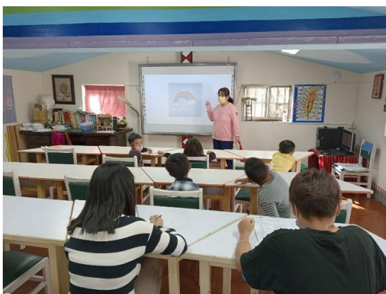
專業教師-公開授課族語師