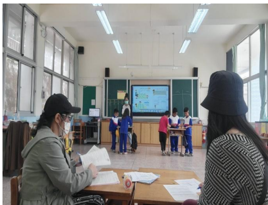
專業教師-公開授課一年級