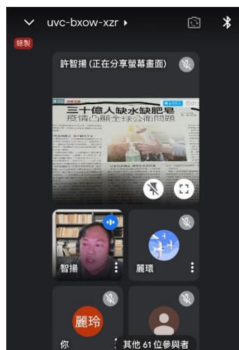
線上閱讀素養研習