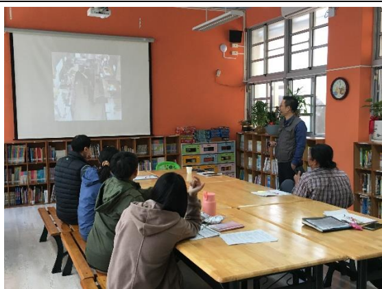
週三進修-閱讀評量素養書寫