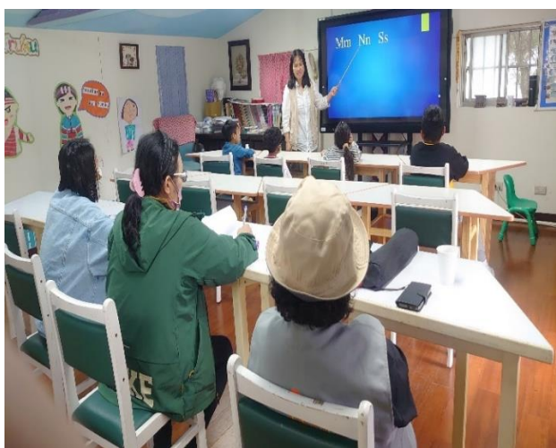
4/22 鄉公所語推人員共同觀課