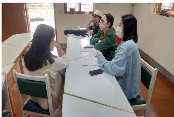
針對優、缺點來議課