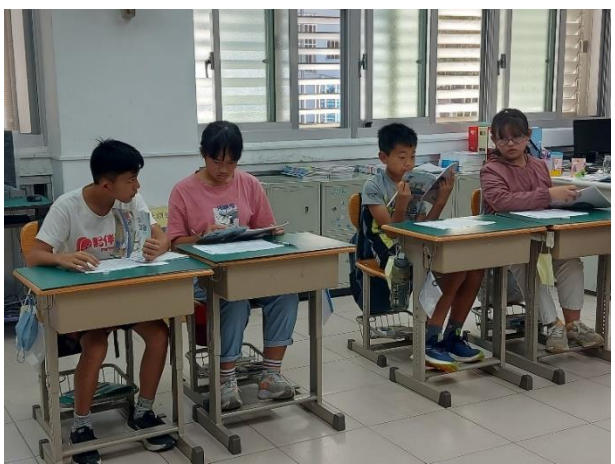
9.20(觀課) 二二相互討論