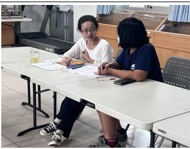
9.25(議課)討論特定學生上課態度