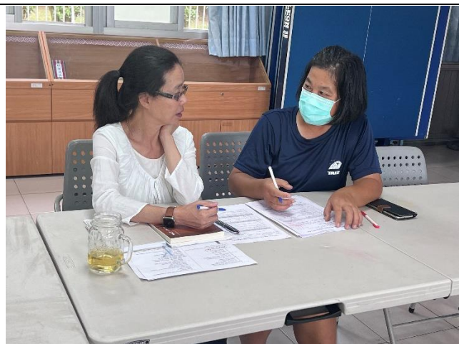
9.25(議課)一起討論課程實施優缺點