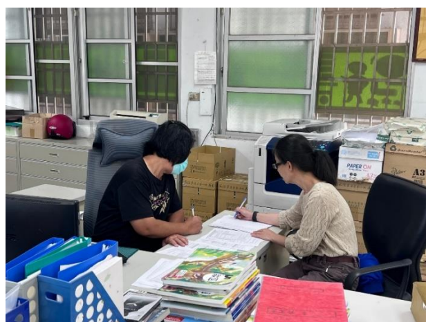
9.19(備課)與識鶴老師討論課程內容