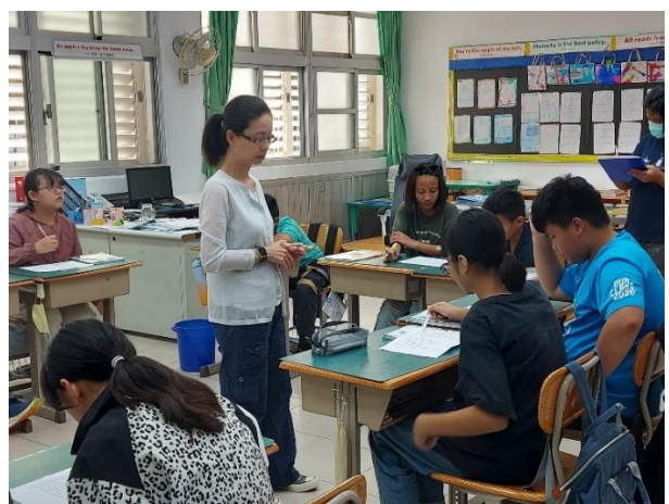
9.20(觀課) 閱讀課文並將不懂的做記號