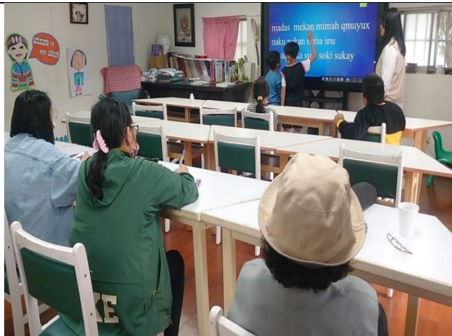
學生將學過的字母圈起來