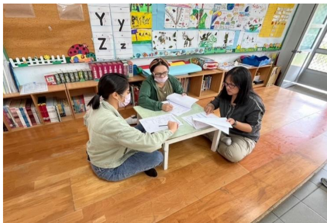
大家都共同盡心備課