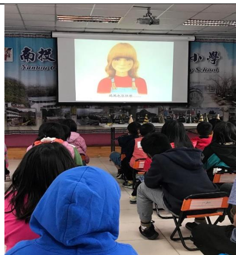
說明:認真聆聽的小朋友