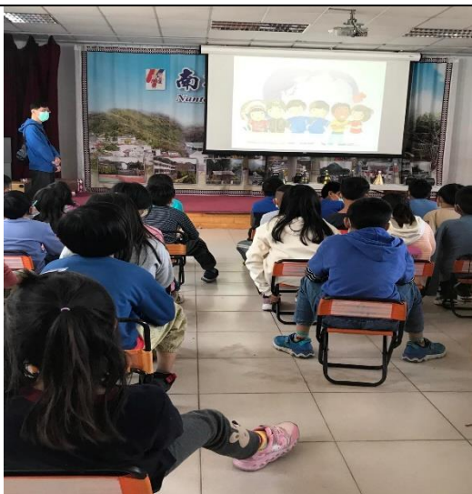
說明: 有獎徵答活動