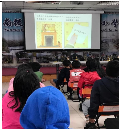
說明: 有獎徵答活動